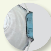
Doble banda de ajuste.