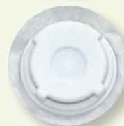
Válvula de exhalación.