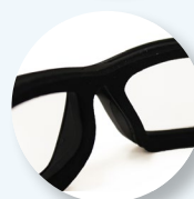
Amplia gama de lentes CE